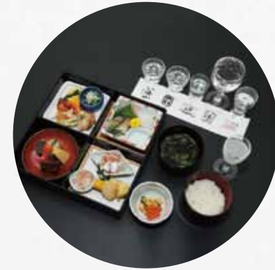
※写真は、第1回落語会のお食事です。